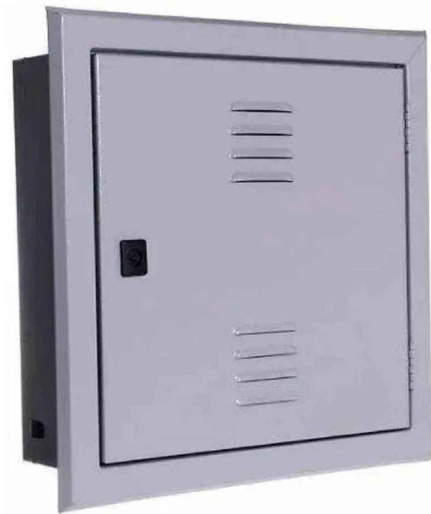
CAIXA 60X60 EMBUTIR PADRÃO TELEBRÁS